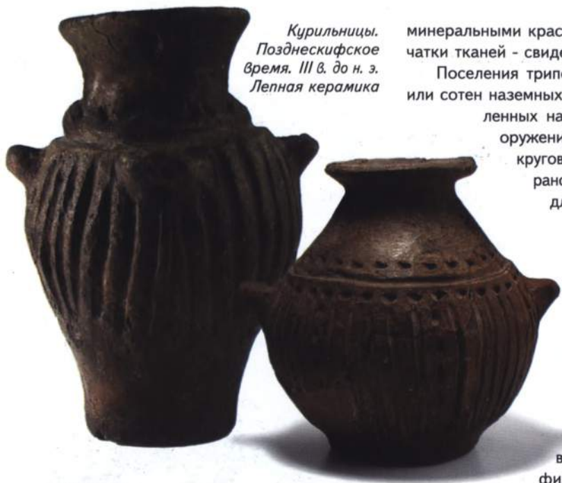
Курильницы. Позднекифское время. III в. до н. э. Лепная керамика

минеральными красками. На дне некоторых сосудов сохранились отпечатки тканей - свидетельство развития ткачества.