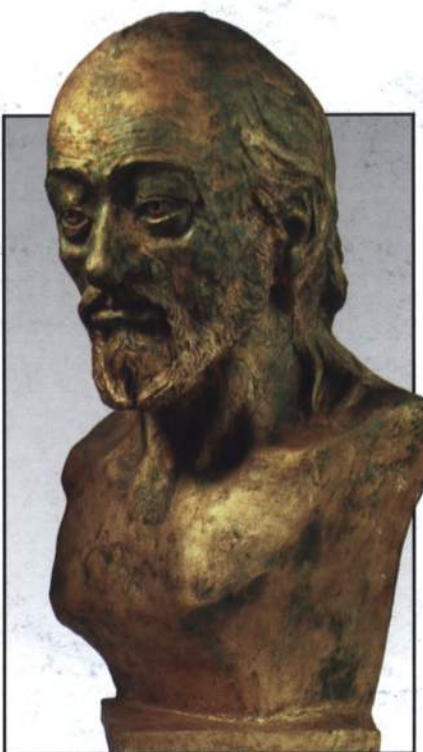
Реконструкция облика вождя позднескифского времени

Ежегодно музей посещают более полутора тысяч учащихся и жителей Приднестровья, интересующихся историей родного края. Нередки визиты и иностранных гостей. Кроме постоянной экспозиции в ПГУ музей осуществляет передвижные выставки по республике, которые пользуются большой популярностью.