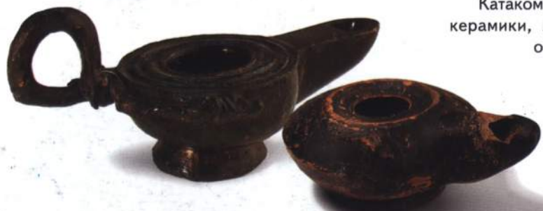
Античная чернолаковая керамика. III в. до н. э.