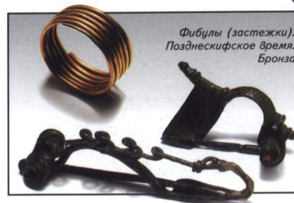
Фибулы (застежки). Позднекифское время. Бронза