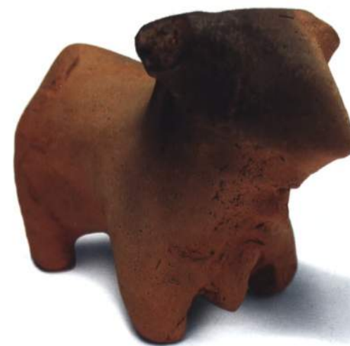
Зооморфная статуэтка. Трипольская культура

Начало осмотра экспозиции предваряет карта республики, на которой обозначены основные памятники различных археологических культур.