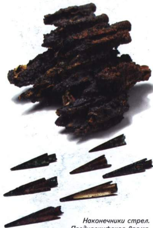
Наконечники стрел. Позднескифское время. Железо, бронза

представлена статуэтка малоазийской богини Кибелы - матери богов, культ которой был распространен у греков-колониатов. На поселении найдены две целые статуэтки, а также фрагменты статуэток Кибелы и других богинь. Обнаружены и такие предметы культа, как лепной домашний алтарь, амулеты с "магическими" линиями, охотничьи амулеты и керамические игрушки.