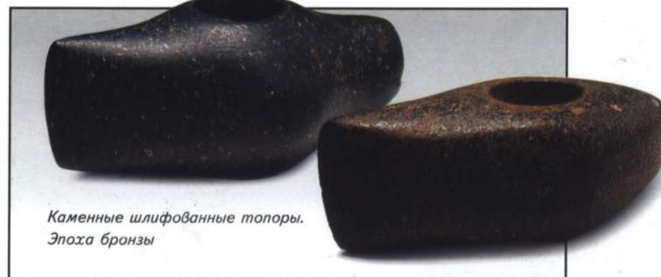
Каменные шлифованные топоры. Эпоха бронзы