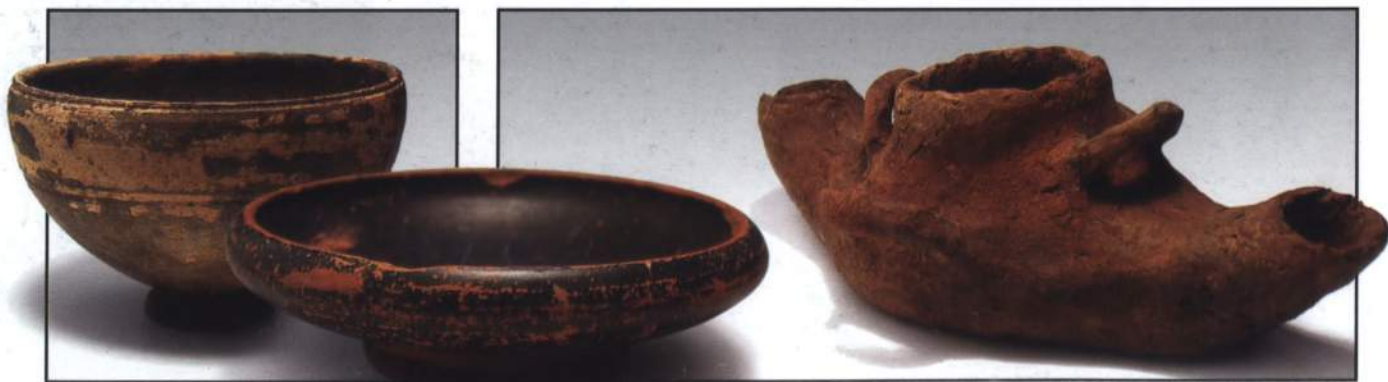
Лепной светильник. Позднекифское время. III в. до н. э.

Четвертый раздел экспозиции посвящен раннему железному веку, который связывают с появлением в IX столетии до н. э. памятников киммерийской культуры.