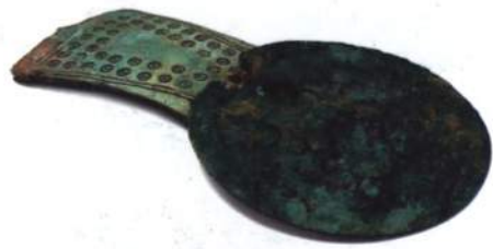
Античные светильники. III в. до н. э. Бронза, керамика