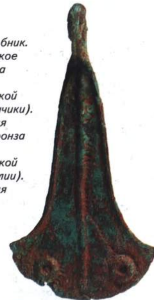
Детали конской сбруи (бубенчики). Киммерийская культура. Бронза