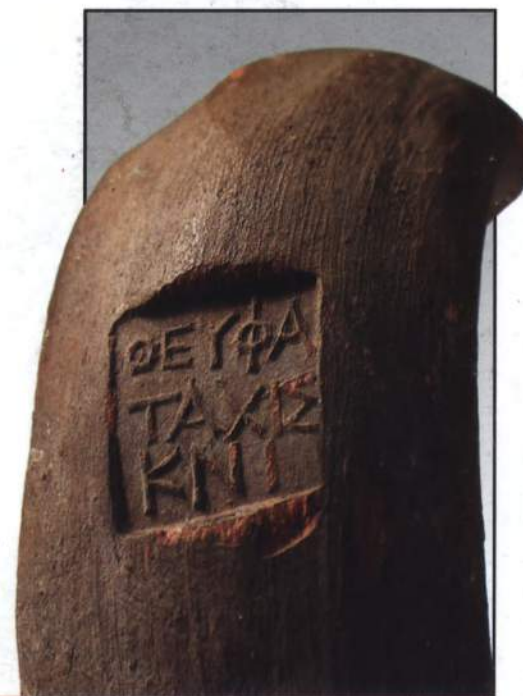
Амфорное клеймо и амфора. III в. до н. э.

Поселение у с. Чобручи возникло, очевидно, в начале IX в. до н. э., а с VI в. до н. э. оно служило торговым эмпорием для греческого города Тире и кочевых народов. В экспозиции