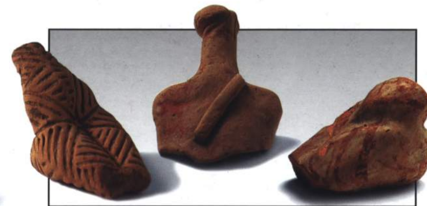
Антропоморфные статуэтки. Трипольская культура

Первый раздел экспозиции посвящен эпохе палеолита ( древнекаменный век ). В этот период происходил процесс антропогенеза и становления человека современного вида ( Homo sapiens ). На территории Приднестровья древнейшие палеолитические стоянки появляются приблизительно 500 тысяч лет тому назад.